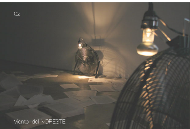
Viento del NORESTE