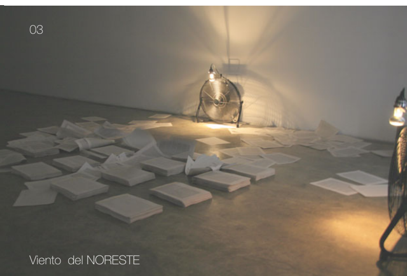
Viento del NORESTE

WIN-D [World · In · Now]·Data, pretende ejemplificar el debate de asumir globalidades desde el control de datos puntuales y locales, confirmando aspectos que plantean la translocalidad en un sistema global a través de una experiencia audiovisual.