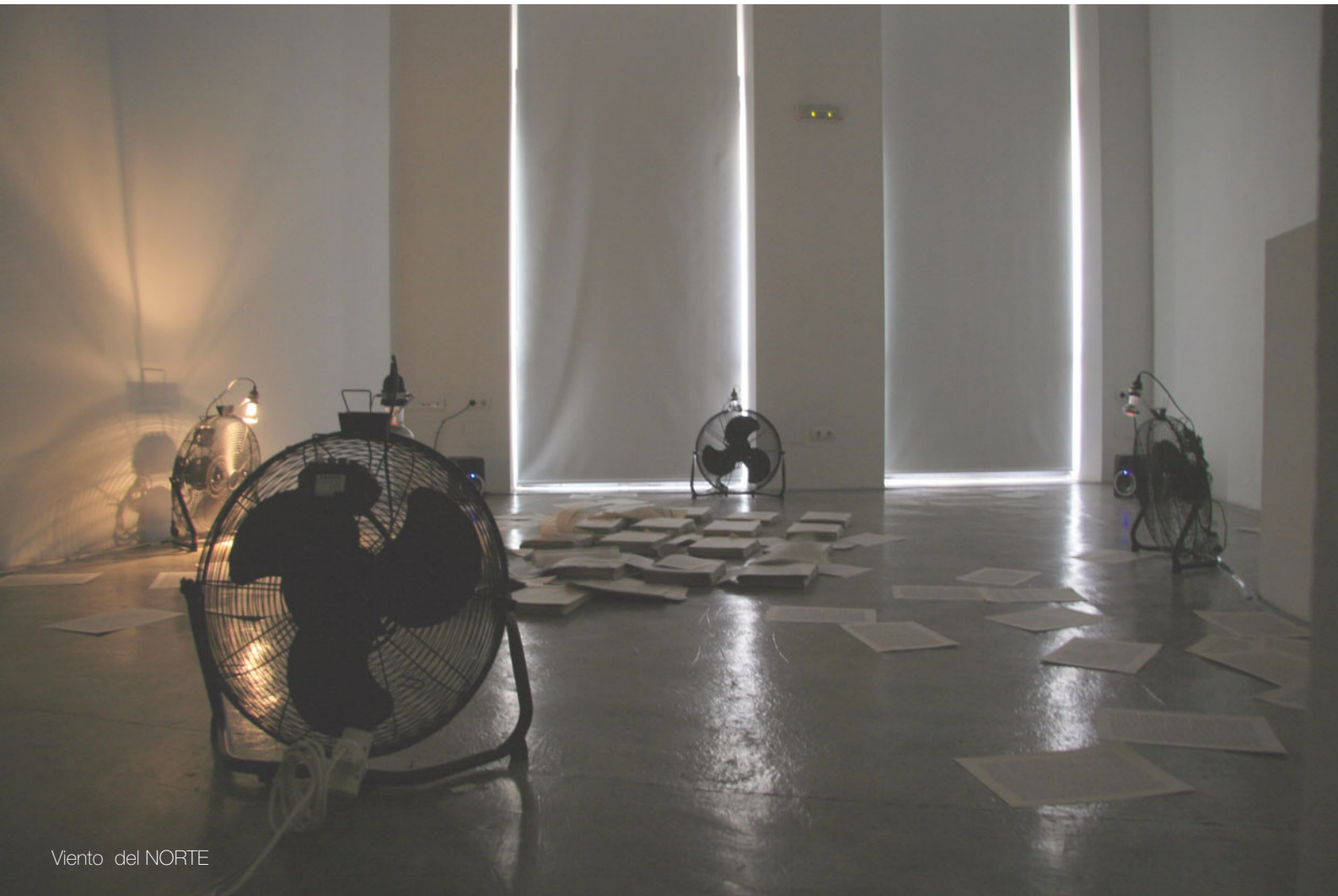
Viento del NORTE

Galería Rosa Santos-[1 Planta]Valencia 15/06-28/07/2007