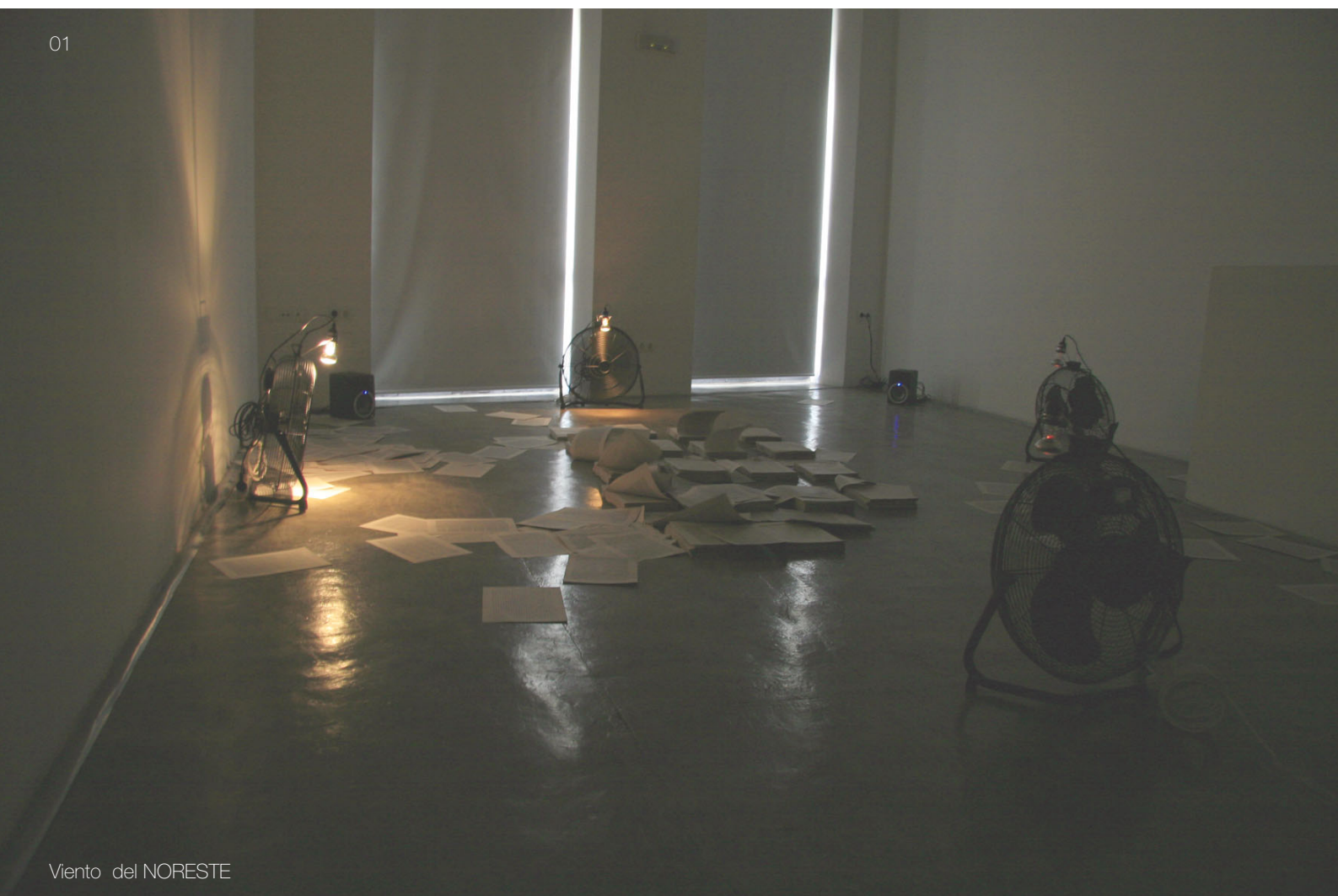
Viento del NORESTE